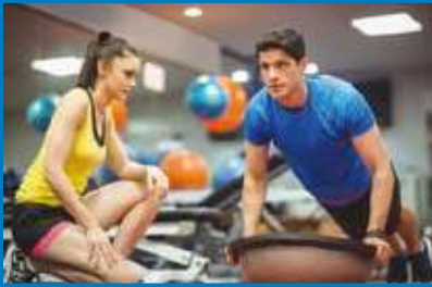
Entraînement en salle

Centre Gabrielle-Granger - 690, rue de Monseigneur-Panet Information : 819 293-6901 poste 1700 ou communaute@nicolet.ca